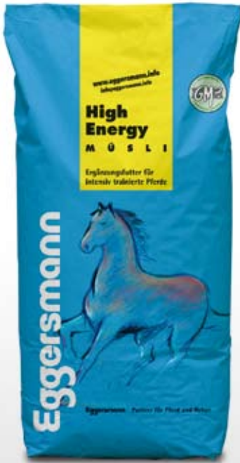
Müsli 20 kg sekk