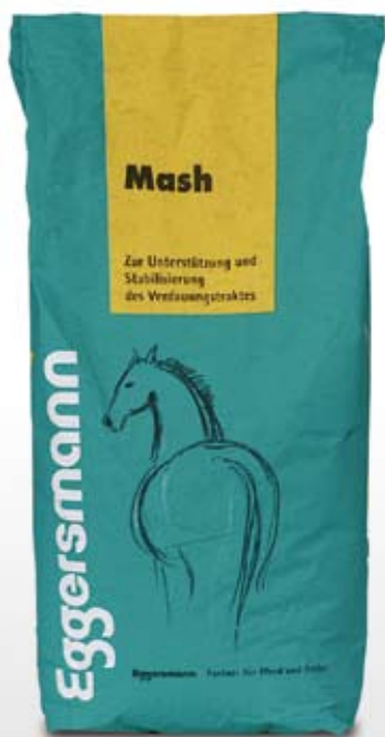
Müslü 15 kg sekk