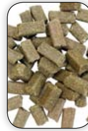
Pellets 15 mm Ø 1kg, 2,5 kg pose og 25 kg sekk