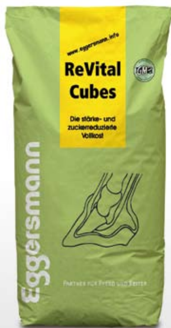
Pellets 25 kg sekk