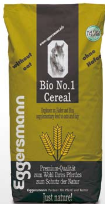
Müsl 20 kg sekk

66 g/kg ford. Protein 11,9 MJ/kg ford. Energi