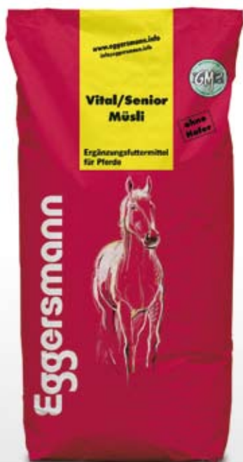
Müsli 20 kg sekk