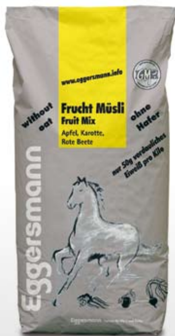
Müsli 20 kg sekk