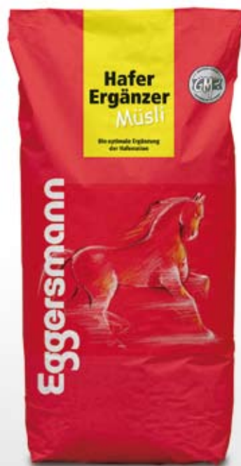
Musli 20 kg sekk

48 g/kg ford. Protein 10 MJ/kg ford. Energi