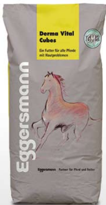
Pellets 5 mm Ø 25 kg sekk