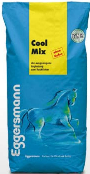
Müsli 20 kg sekk