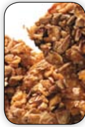
Forpakning: 2 stk