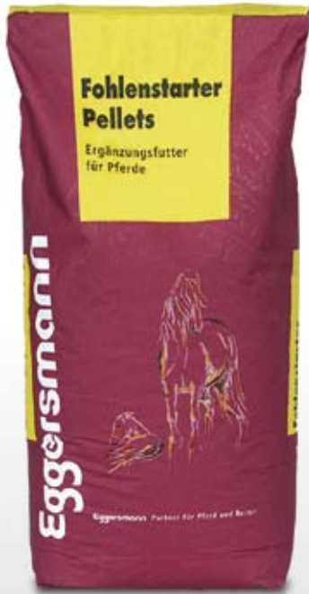
Pellets 5 mm Ø 25 kg sekk