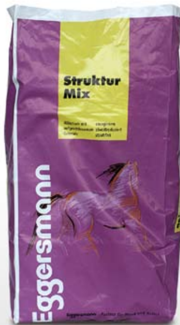
Müslü 25 kg sekk

79 g/kg ford. Protein 11,4 MJ/kg ford. Energi