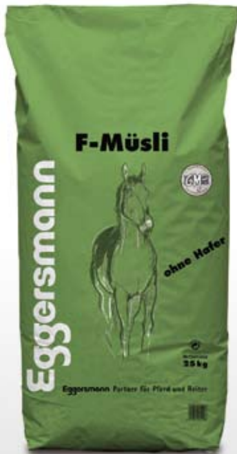
Müsli 25 kg sekk