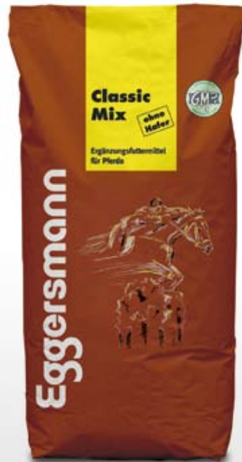
Müsli 20 kg sekk

70 g/kg ford. Protein 10,4 MJ/kg ford. Energi