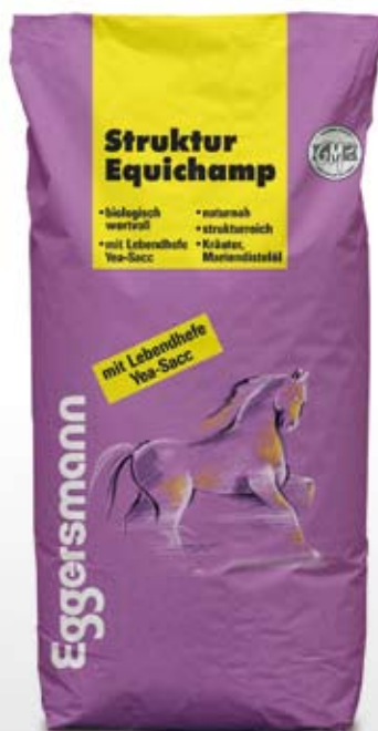
Müsli 20 kg sekk

80 g/kg ford. Protein 11 MJ/kg ford. Energi