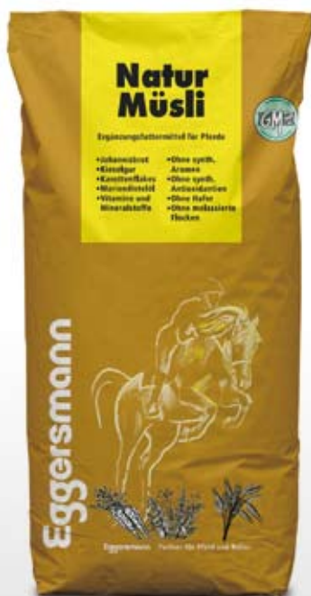
Müsli 20 kg sekk