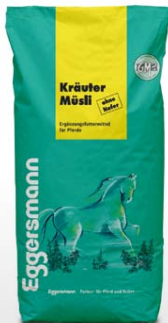
Müsli 20 kg sekk

72 g/kg ford. Protein 12,2 MJ/kg ford. Energi