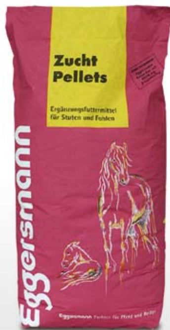
Pellets 5 mm Ø 25 kg sekk

115 g/kg ford. Protein 11,2 MJ/kg ford. Energi