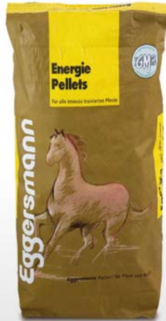
Pellets 5 mm Ø 25 kg sekk

95 g/kg ford. Protein 13,5 MJ/kg ford. Energi