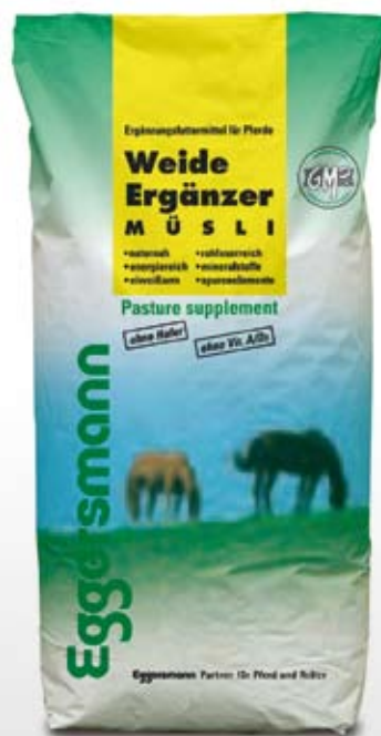
Musli 20 kg sekk

55 g/kg ford. Protein 9,5 MJ/kg ford. Energi