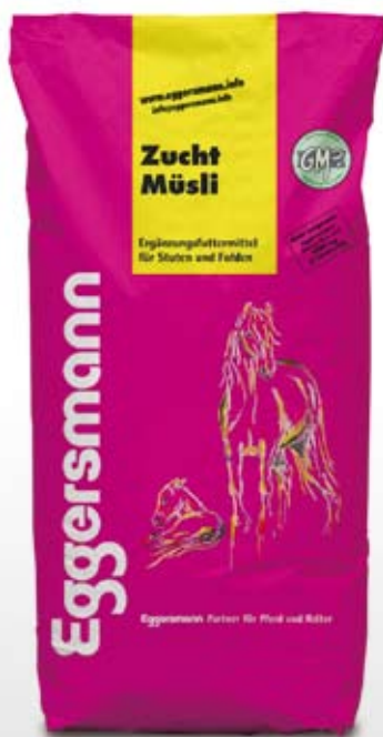
Müsli 20 kg sekk