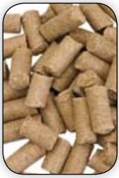
Pellets 15 mm Ø 1 kg