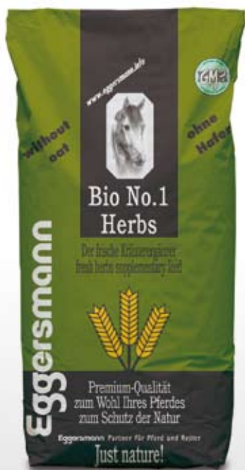
Müsl 20 kg sekk