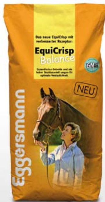
Müsli 15 kg sekk

80 g/kg ford. Protein 10,1 MJ/kg ford. Energi